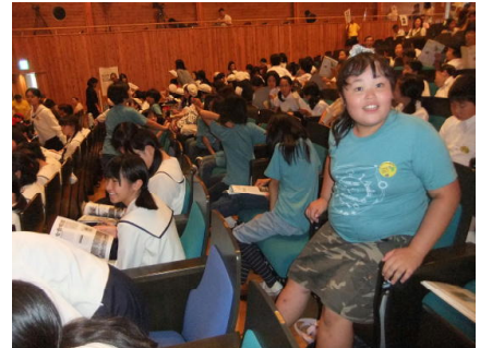
たくさんのお客を集めたジュニアコーラスの祭典

さて、32日間の夏休みが終わり、80日間の2学期がスタートして2週間程が過ぎました。26日の初日、玄関で久しぶりに朝のあいさつを交わす子どもたちの目線の高さに大きな成長を感じました。また、始業式での落ち着いた姿にも夏休みの充実感を見て取ることができ、とてもうれしく思いました。これも各家庭や地区で、夏休み中の思い出づくりや安全、健康に対するご配慮があったからだと思います。ありがとうございました。また、今年の夏休みは、国文祭のジュニアコーラスの祭典への出演や能楽の練習、スポ少の試合や大会遠征など大好きな事への取り組みが盛りだくさんで、たくさんの思い出ができたことと思います。